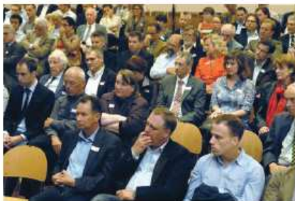
Die Schweizer FDP-ler im Forum Triengen bei der Gemeindevorstellung