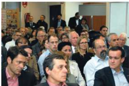
aufmerksame Zuhörer in der Arche

Am 6. Juni 2012 ging die FDP-Bundeshausfraktion auf die Reise. Diese führte sie nach Triengen, wo zuerst die Trisa besucht wurde. Nach der offiziellen Begrüssung im Ausstellungsraum „Arche“ ging es zum Werk 3 auf Besichtigungstour. Vor der Produktionsbesichtigung gab es für alle Besucher weisse Hygienemäntel und Haarnetze zum Anlegen. Beim Rundgang durch die Produktion konnten die FDP-ler den Werdegang einer Zahnbürste, vom Granulat bis zum fertigen Produkt verfolgen. Im Weiteren wurde demonstriert was mit den Ausschusszahnbürsten passiert. Diese werden geschreddert und das Material wird wiederverwendet. Auch die Zukunftsweisenden Energielösungen bei der Trisa wurden den FDP-Leuten vorgestellt. Alles in allem waren die Besucher begeistert von diesem Hightech-Betrieb. Zum Schluss der Trisa-Besichtigung wurde den FDP-Mitgliedern ein Produkt präsentiert, das in Europa nicht verkauft wird, sondern nur in den USA. Die Einwegzahnbürste mit integrierter Zahnpasta, die ohne Wasser funktioniert.