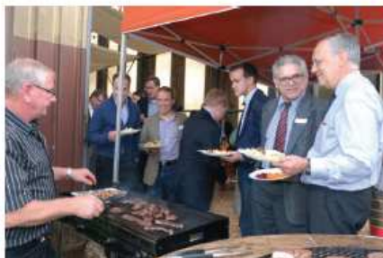
Bundesrat Schneider-Ammann beim Fassen des leckeren Nachtessens. Auch ein Bundesrat hat mal Hunger ...