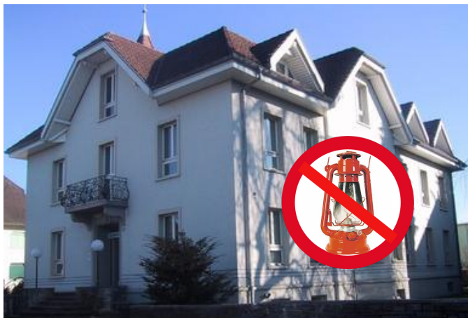
Triengen trägt die rote Laterne nicht mehr...

ge vermelden. Es wurden keine Quartalsabschlüsse erstellt, jedoch zumindest ein Halbjahresabschluss. Massiv gespart wurde nur bei der Bildung. Der budgetierte Minderaufwand bei der sozialen Wohlfahrt muss mit Vorsicht bewertet werden.